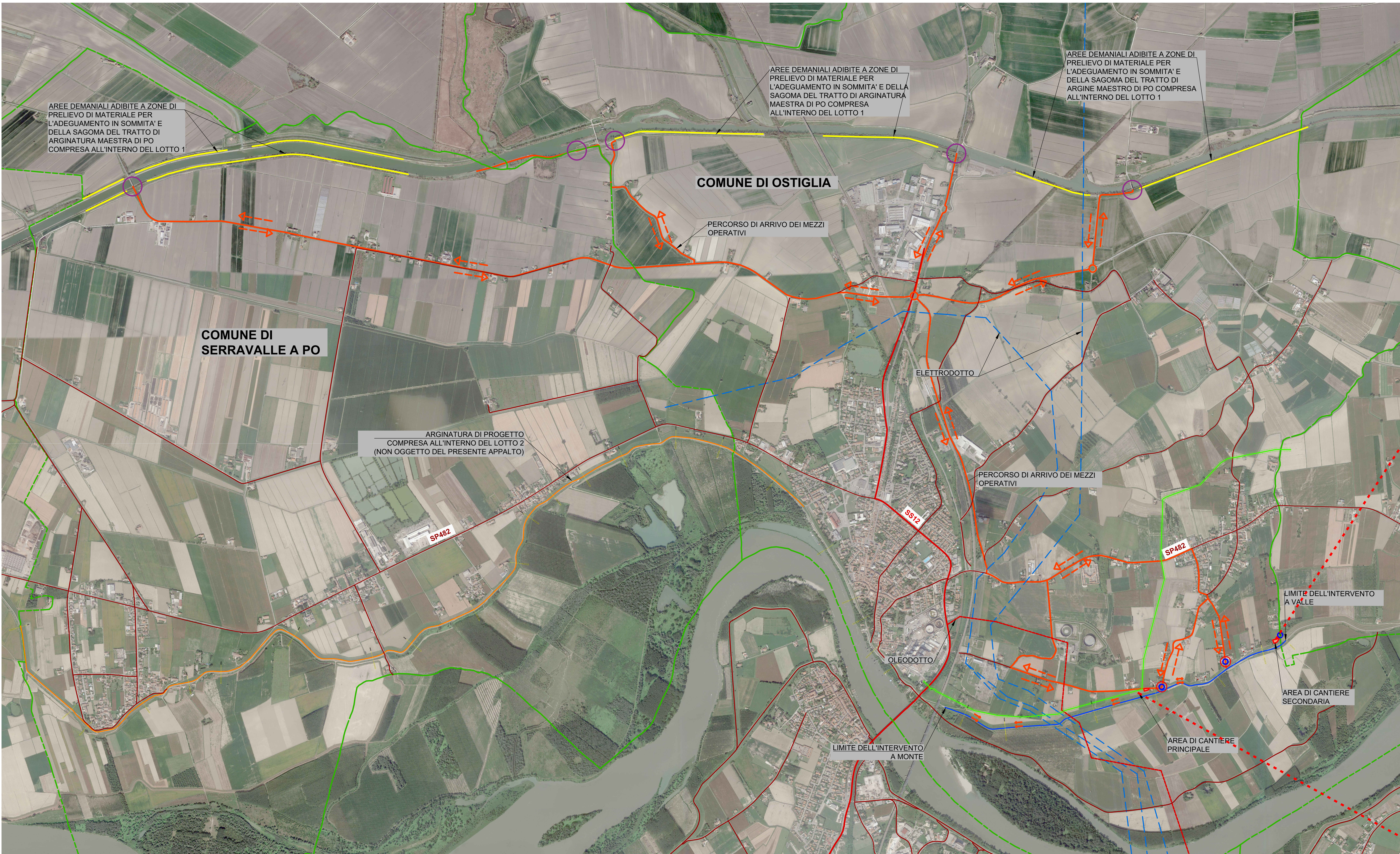
PLANIMETRIA GENERALE - SCALA 1:10.000